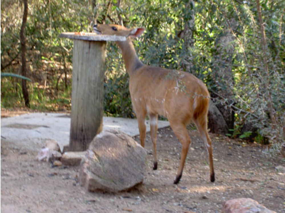
bushbok bij (vogel)voederplaats