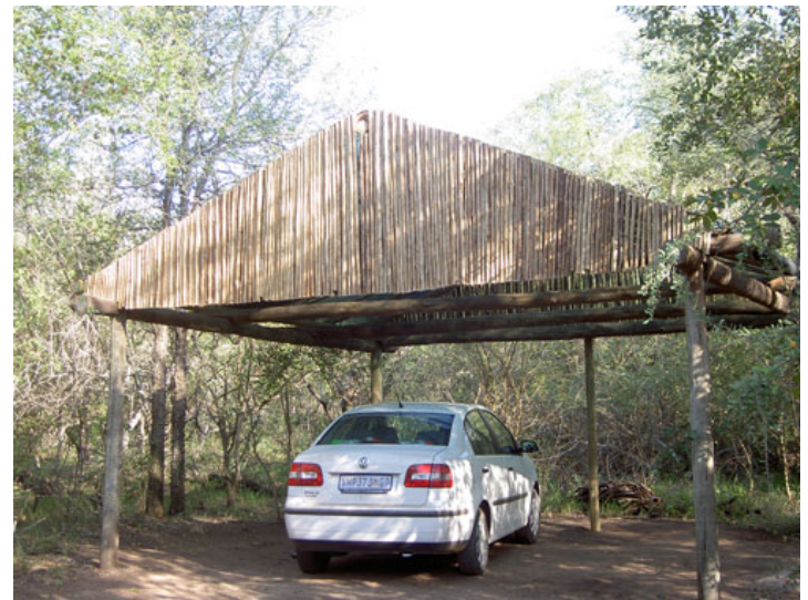
de Afrikaanse carport is klaar!