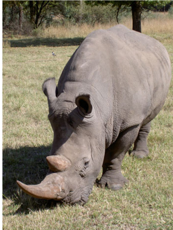
neushoorn in KNP

Onze kinderen, 6 en 10 jaar, vonden het ook helemaal geweldig. De dieren bij het huis, de safari's enz. Wij hebben de ene dag b.v. een safari gedaan en de andere dag naar Komatipoort en zwemmen. Dit concept werkt goed bij ons en onze kinderen.