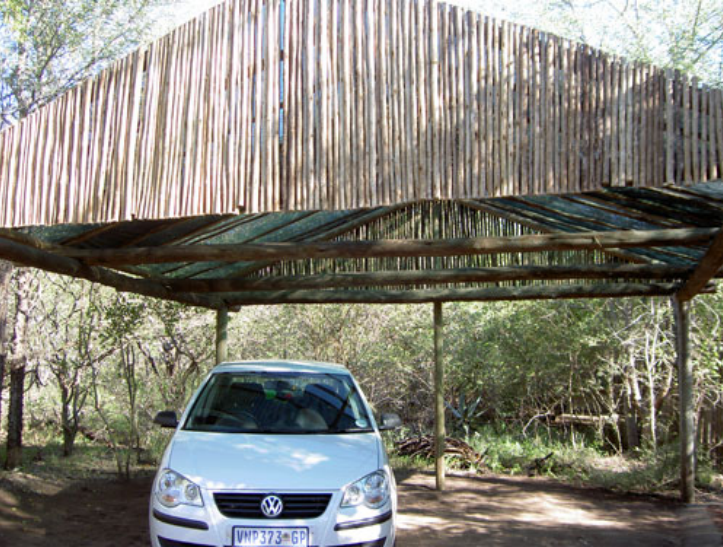
de nieuwe carport