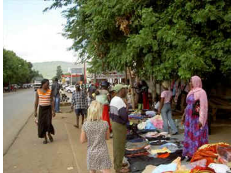
Rissikstraat in Komatipoort

Eten is een paradijs in Zuid-Afrika, de mensen maken hier nog echt werk van! Toppie die Bushburger, ja lekker ben ruim 3 kilo aangekomen. Al met al voor herhaling vatbaar.