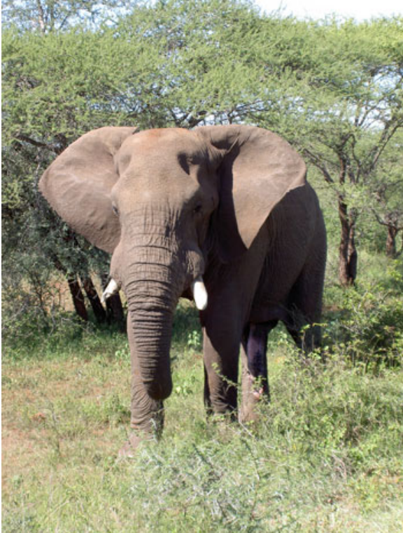
olifant in KNP