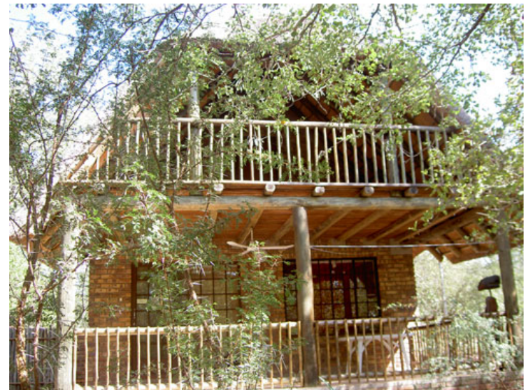
Mhofu in mei 2007