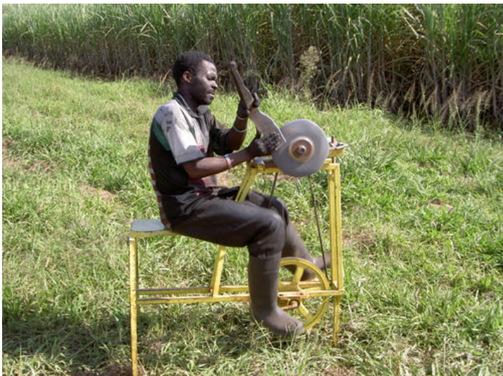
Afrikaan sluipt zijn kapmes

Komatipoort is een dorpje geheel naar onze wens, aardige mensen, lekker sfeertje, en lekker simpel zoals wij ook zijn. Op Mhofu hebben we genoten van alle dieren die in de ochtend en avonden voorbij kwamen, we zijn niet erg uitgerust want we waren meestal om 0600 uur op omdat we dan wakker werden van de dieren!