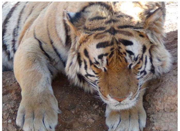
Een van de tijgers in de Tiger Canyon