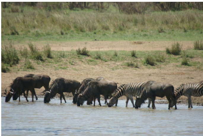
Op weg naar Maroela