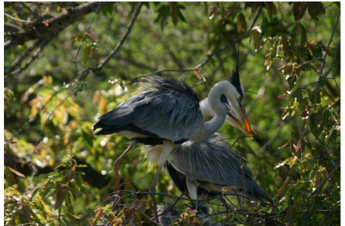
Zie je de kleintjes zitten?