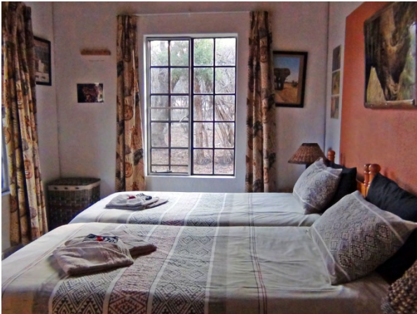
update van de slaapkamer's