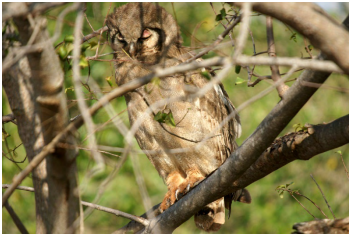
De grootste uil, de oehoe