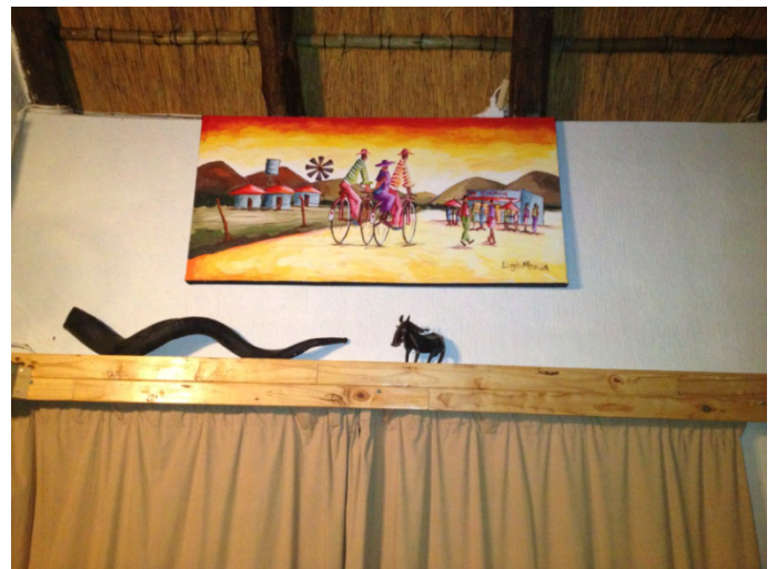
Nieuwe olieverf, kado van onze vrienden Xan en Ries