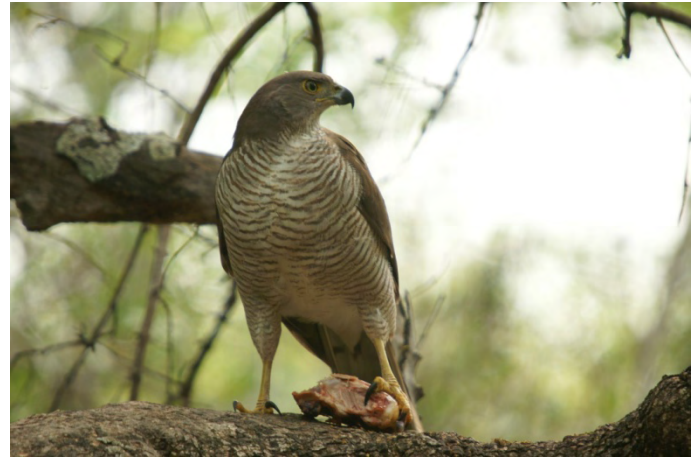
Onze Afrikaanse sperwer in de tuin Mhofu