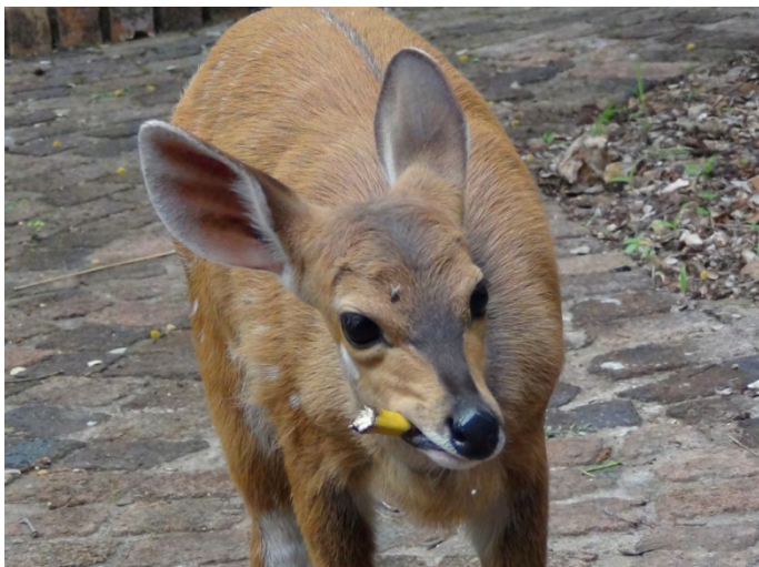
Ons lieve bosbökkie