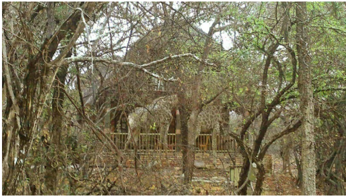
Giraf bij Mhofu